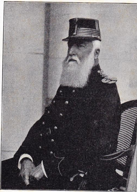
S. M. le Roi Léopold II, Haut Protecteur du Touring Club de Belgique.

Ce fut Lui qui sut obtenir du gouvernement la première piste cyclable, celle de la drève de Meysse, dont le corollaire fut bientôt la création d'un énorme réseau de voies cyclables à travers le pays tout entier. L'impulsion était heureusement donnée et il devint bientôt impossible de résister aux exigences si fondées des adeptes de la petite fée triomphante. En vue de commémorer l'inauguration de la dite voie cyclable de Meysse, dénommée piste Léopold II, un poteau artistique en fer forgé, produit de souscriptions particulières, fut érigé naguère à l'orée de la voie nouvelle. Par pieuse reconnaissance envers