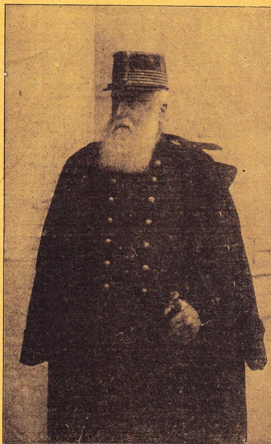
S. M. le Roi Léopold II, Haut Protecteur du Touring Club de Belgique.

Envoi gratuit de l'Annuaire, du Manuel du touriste, du Manuel de conversation, du Catalogue de la bibliothèque et, deux fois par mois, du Bulletin officiel illustré.